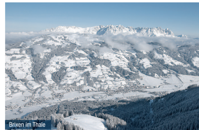
Brixen im Thale

Niet alleen bij alpineskiërs gaat het hart in de drie plaatsen sneller slaan, want in Brixen im Thale, Kirchberg en Westendorf voelt ook de Freestyle-scene zich thuis. Zo geldt de 'Boarders Playground' in Westendorf, een park voor snowboarders en freestylers, als absoluut Mekka voor de funsport. Een absolute must voor de echte freestylers zijn unieke evenementen zoals bijvoorbeeld 'Jump & Freeze' en de 'Shred Down' in Westendorf. Andere spannende evenementen zoals bijvoorbeeld de FIS-wedstrijd of de Hahnenkamm-Warm-Up-Nachtslalom rond de wintersportvakantie in het Brixental af. Voor degenen die de dag niet lang genoeg vinden, bieden Brixen im Thale, Kirchberg en Westendorf ook 's nachts genoeg activiteiten: nachtliefhebbers kunnen rodelen op een verlichte natuurlijke rodelbaan of op speciaal geprepareerde en perfect belichte pistes naar beneden skiën. Natuurlijk wordt aansluitend ook gefeest: bars, clubs, pubs en discotheken zorgen voor een intensief nachtleven voor de scene. Meer informatie vindt u op www.kitzbuehel-alpen.com/nl en bij het Tourismusverband Kitzbüheler Alpen – Brixental, Tel. +43 (0) 5357 2000.